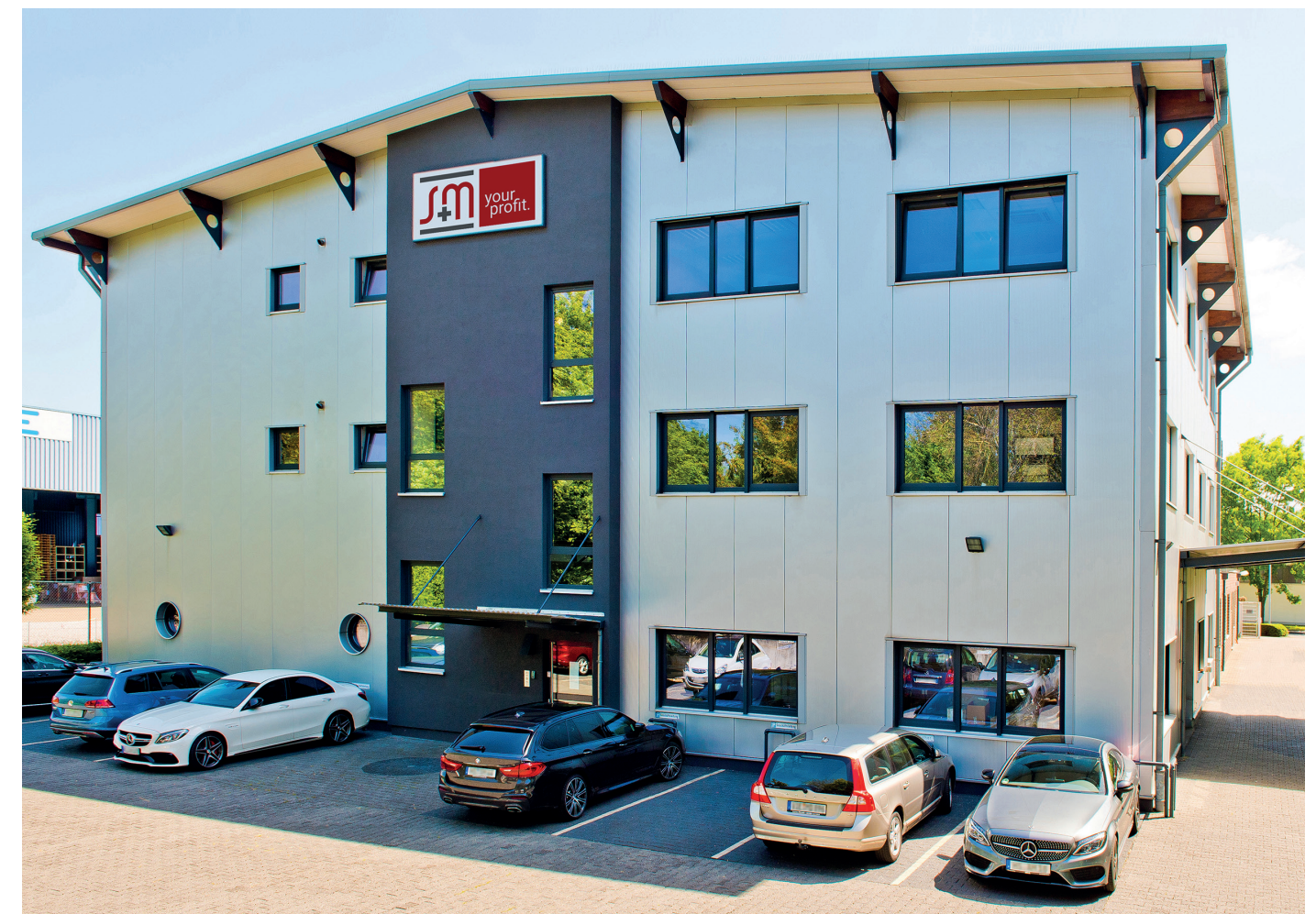
Das einladende Geschäftsgebäude der Zahlungssystemspezialisten von der S+M GmbH. Das familiengeführte Unternehmen aus Erkelenz steht ebenso für perfekte Produktqualität wie für Transparenz und persönlichen Kundenservice. Mit ihrer Komplettlösung Vensolutions und dem Zahlungssystem Venpay CL ist die S+M GmbH erfolgreicher und geschätzter Partner der Vending-Branche.

reich (OpenLoop, OL) eine breite Kartenakzeptanz (VISA, Master Card, Co-Branded-Karten), die Installation eines Vencube oder Vensells OL-Moduls im Automaten vorausgesetzt. Dabei ist der UPT1000F als reines MDB-Zahlungssystem nutzbar, oder in Kombination mit dem Vencube Beta als integrierte Telemetrie-Lösung inklusive aller Auswertungen.