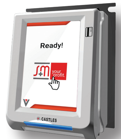
Der UPT1000F von Castles bildet mit seinem Touchscreen das Herzstück von Vensells OL.

Als zusätzlichen Service vermittelt das Unternehmen gerne zu Layout und Fertigung eines kompletten Micro-Markets nach den eigenen Wünschen und Vorgaben. In praktischer Modulbauweise lassen sich verschiedenste Shop-Elemente miteinander kombinieren, so dass für jeden Anwendungsfall die ideale Lösung bereitsteht. Ob Frischwarenauslage, Glaskühlschrank, Kaffeebereiter oder Mikrowelle: Hier ist man für jeden Einsatz gerüstet. Operator haben mit der S+M GmbH genau den richtigen Partner an der Hand.